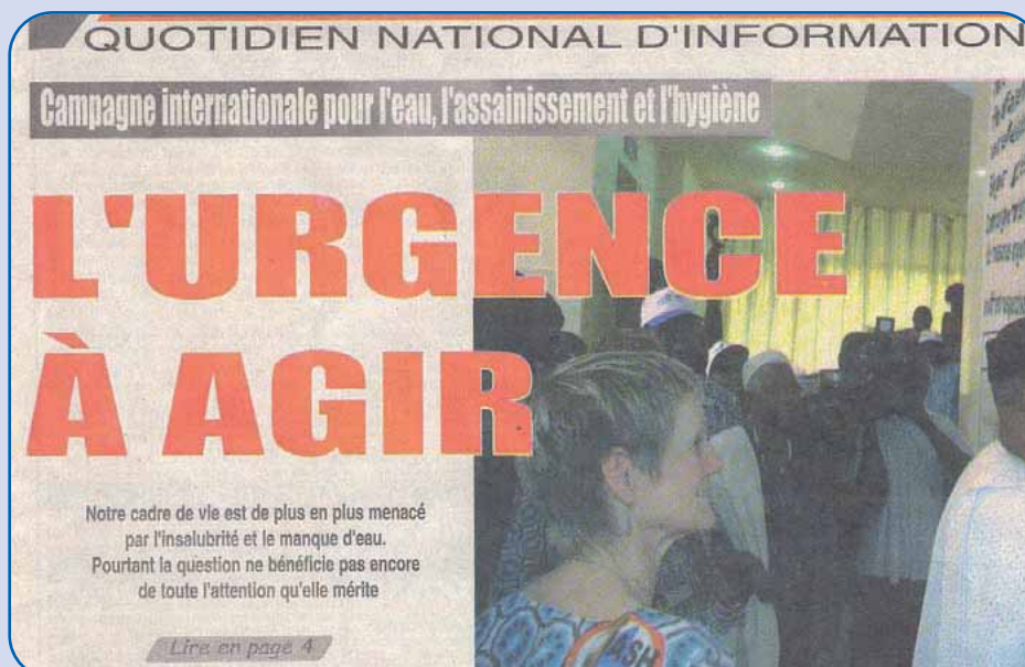
El presidente de Mali firma la petición

http://www.endwaterpoverty.org/news__events/42.asp